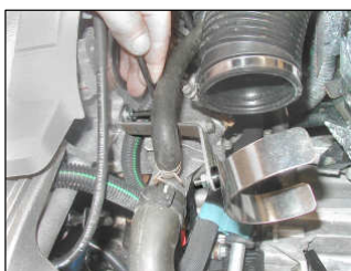
Fig. # 5