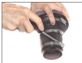
Fig. # 6