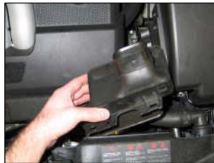
Fig. # 18