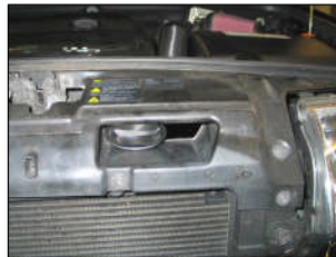
Fig. # 19