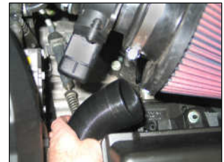
Fig. # 20