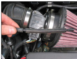
Fig. # 18