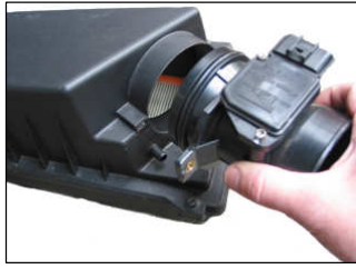
Fig. # 10