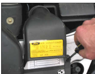
Fig. # 5