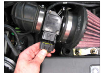
Fig. # 16