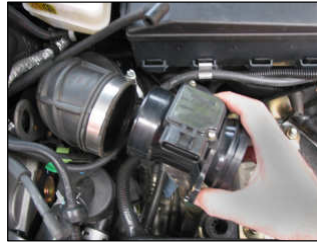
Fig. # 11