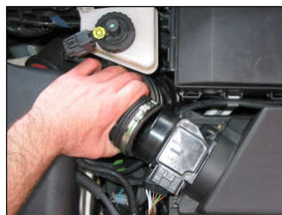
Fig. # 2