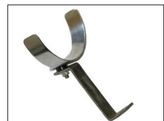
Fig. # 8

For technical support contact our European technical team: "eindhoven.tech@knfilters.com" We will try to answer your mail within 48 hours.