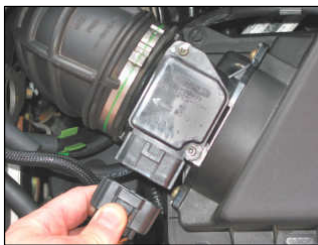
Fig. # 1

For cleaning instructions please visit our website: www.knfilters.com/cleaning