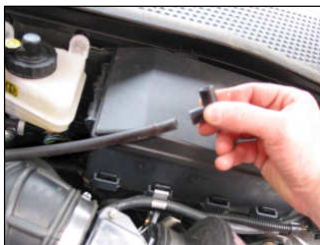
Fig. # 17