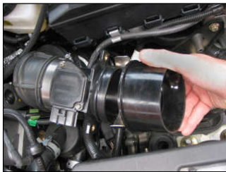
Fig. # 13