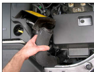
Fig. # 6