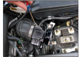
Fig. # 12