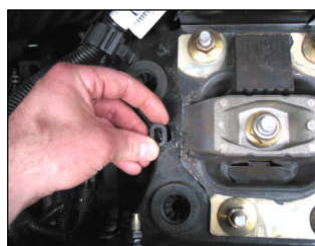
Fig. # 7