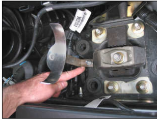
Fig. # 9

Ford Focus TDCi 1.8L Turbo Diesel 100/115bhp 2001-2005