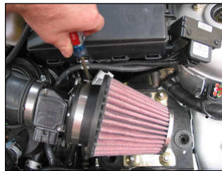
Fig. # 15