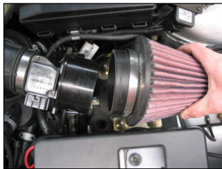
Fig. # 14