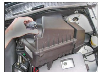
Fig. # 4