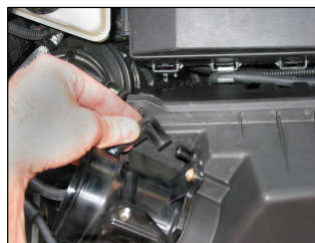
Fig. # 3