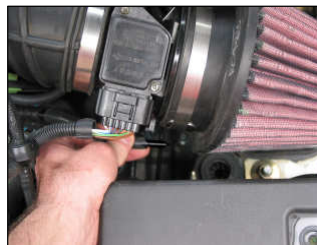
Fig. # 19