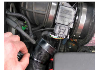
Fig. # 20