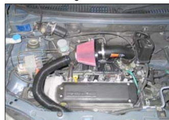
Fig. # 19