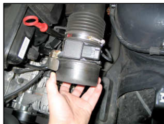
Fig. # 6