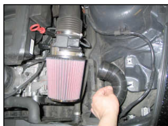
Fig. # 10