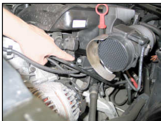
Fig. # 5