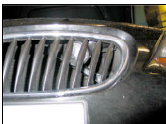
Fig. # 9