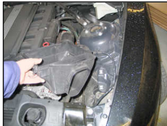
Fig. # 3